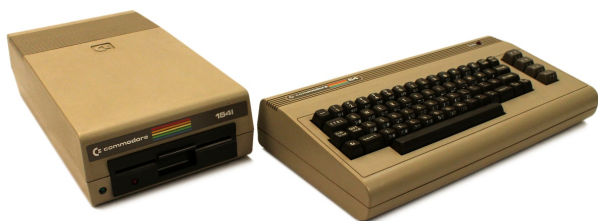
Il C=64 del Museo degli Strumenti per il Calcolo

Il VIC-20 sarà il primo calcolatore a vendere oltre un milione di pezzi. Il suo successore, il C=64 straccerà il record con cifre che a seconda delle stime vanno da 12.5 a 17 milioni di esemplari. Nessun altro modello di calcolatore ha mai fatto tanto. In anni recenti hanno venduto di più alcuni modelli di tablet, di smartphone e ovviamente di console per videogiochi. Ma non contano: sono calcolatori solo formalmente.