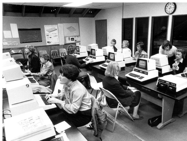
Dei PET seconda serie usati in un corso di riqualificazione professionale

Con il sostegno finanziario del canadese Irving Gould, Tramiel e Peddle cominciano a lavorare insieme. Il KIM-1 nel '76 diventa un prodotto Commodore che spopola fra gli hobbisti che se lo rifiniscono aggiungendo tastiera, monitor, registratori a cassette, stampanti etc. Il 6502 fu di ispirazione per altri prodotti simili come il VIM-1 prodotto dalla Synertek già a fine 1975 (e poi ridenominato SYM-1 ) o l' Apple-1 del 1976, anch'esso progettato intorno al processore di Peddle.